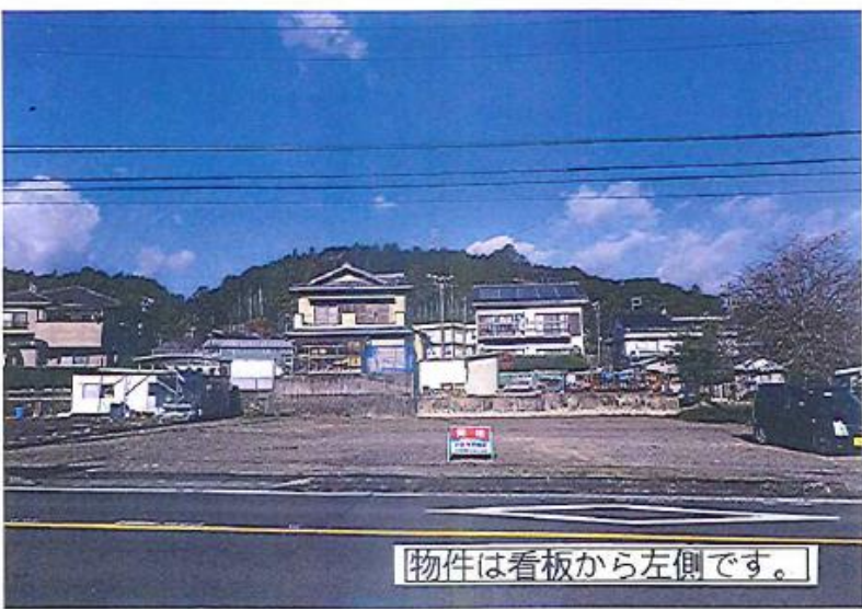
物件は看板から左側です。